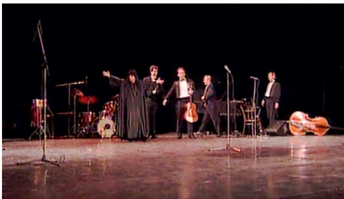
EWA DEMARCZYK - KONCERT POLSKA