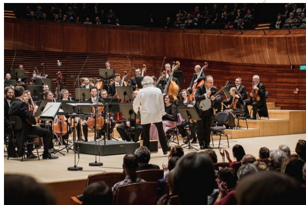
NOSPR - DYR. JERZY MAKSYMIOUK