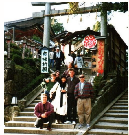
EWA DEMARCZYK - JAPONIA TOUR 1993